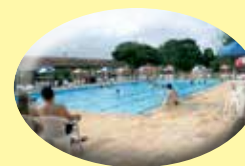
Colônia de Férias na praia de Guaratuba