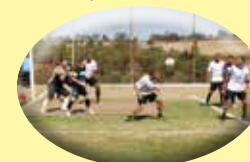
Sede campestre: Campo de futebol