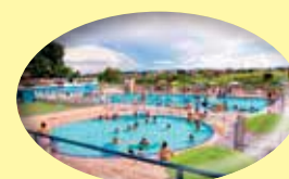
Sede campestre: ampla área de lazer