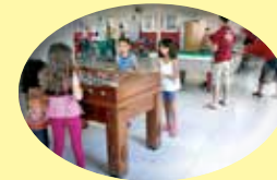
Sede campestre: salão de jogos