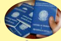
Faça sua Carteira Profissional no sindicato

L.P.C-LABORATORIAL DE PATOLOGIA E CITOLOGIA IMAGEM LONDRINA ECOCARDIO