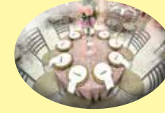
Sede campestre: salão de festa 280 pessoas