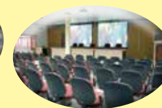
Auditório - 190 pessoas Alugamos para empresas do ramo no comércio