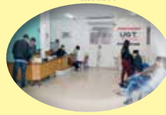
Atendimento diário aos comerciantes, em todos os setores