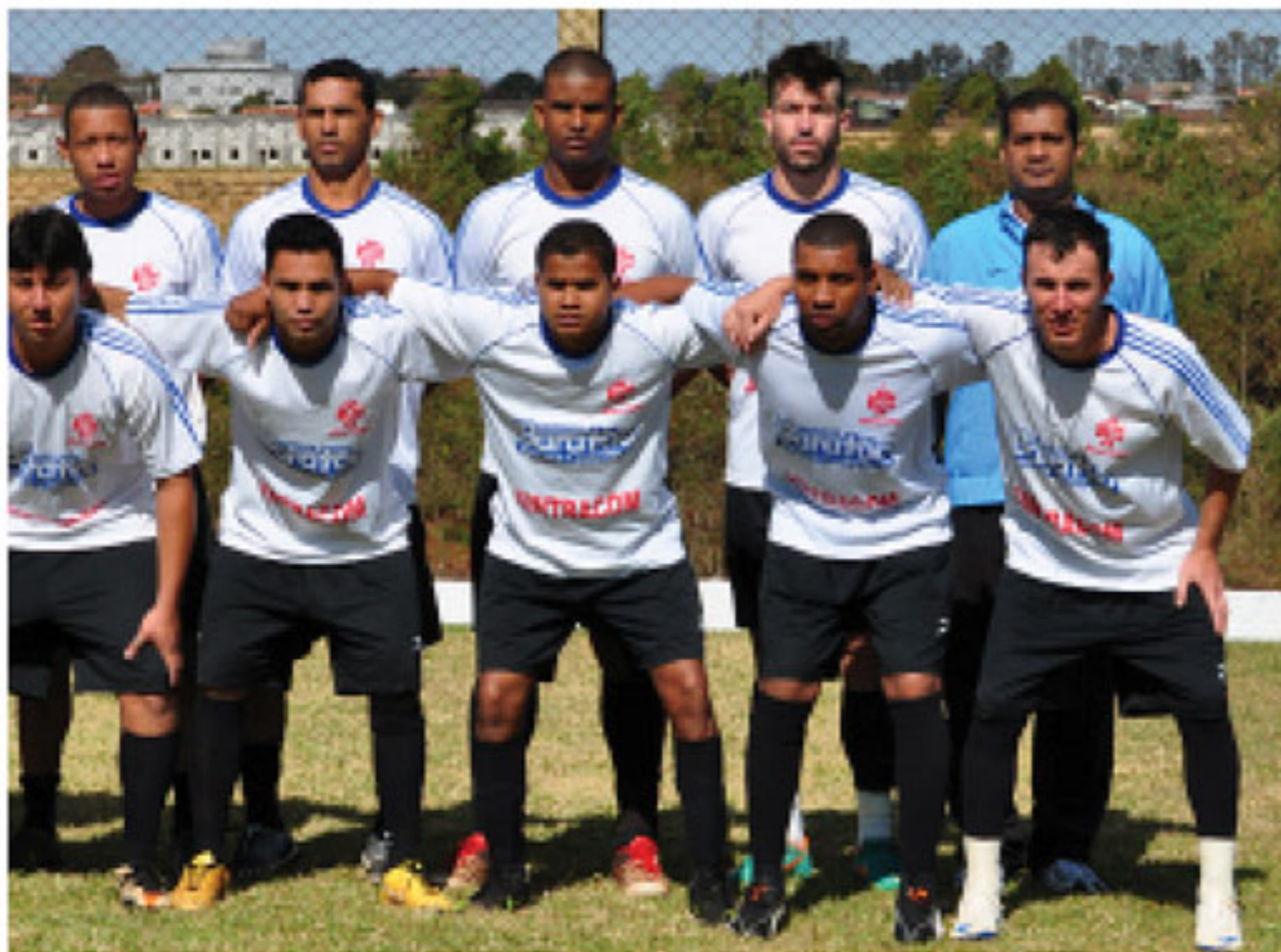
Aranda Motos / Panificadora Pão Francano - Campeão