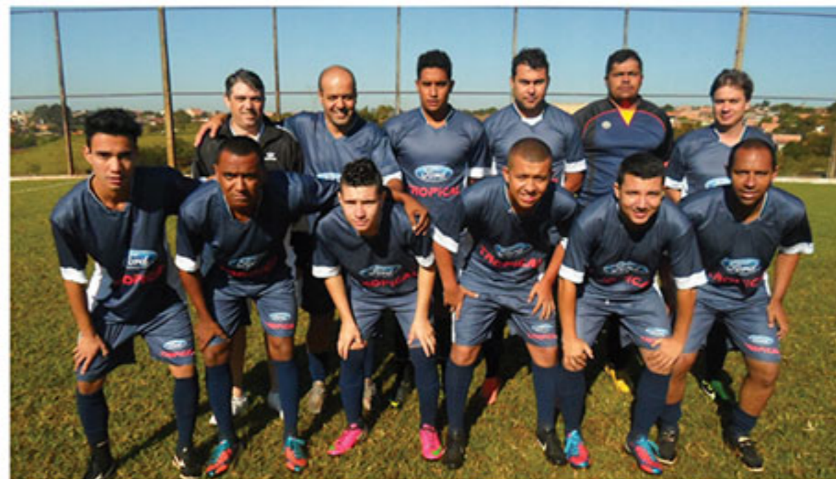
Ford Tropical / Pura Raça Jeans - 4º lugar