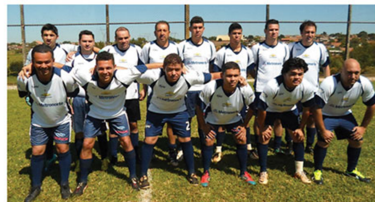
Metronorte e Revestilon