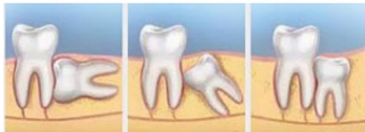
O dente do siso pode nascer em várias posições