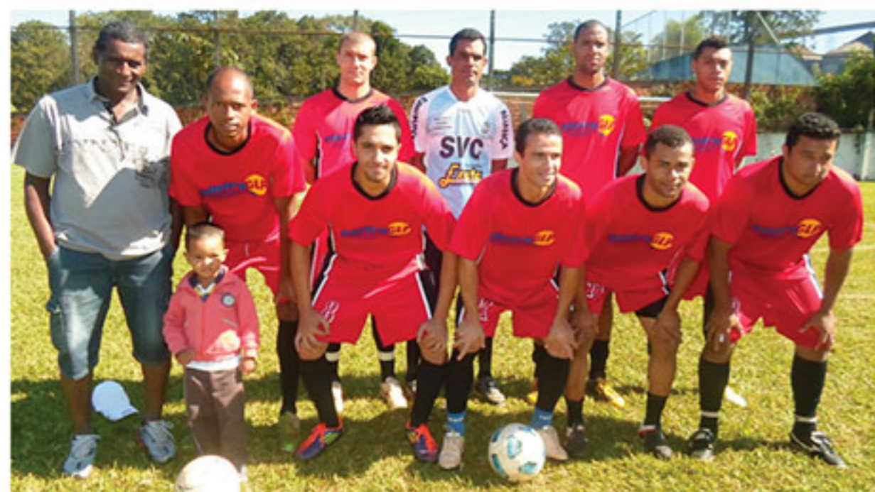
Eletro GLP - 3º lugar