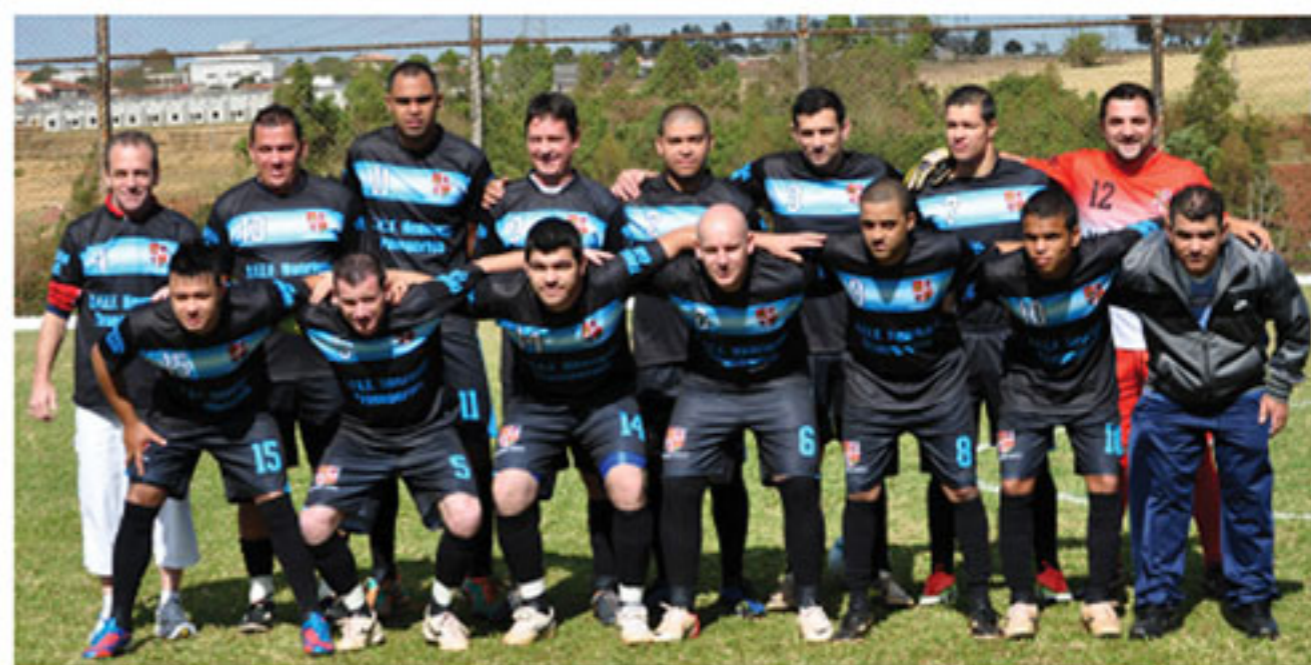
A Grande Família - Vice-Campeão

Esta foi a 38ª edição do Campeonato Interno de Futebol Suíço e as equipes participantes já se preparam para o próximo, que começa em setembro. A organização do torneio, a estrutura do sindicato e o