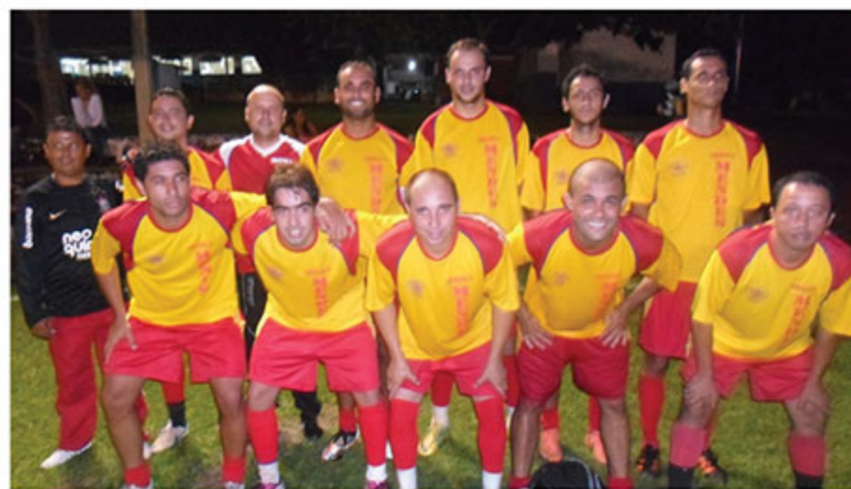
Os Parceiros / Gráfica Mendes